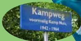
De Drie Polders