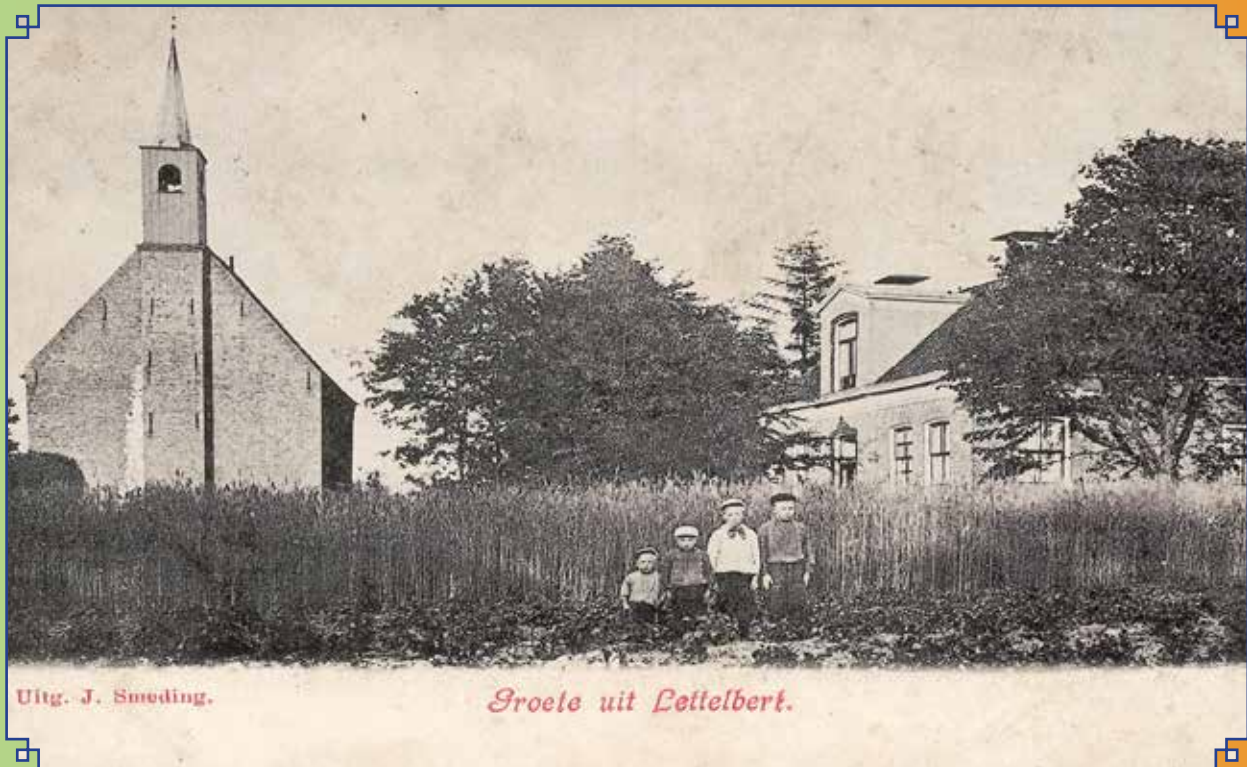
Uitg. J. Smeding.