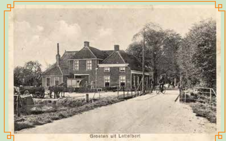
Groeten uit Lettelbert

In 1964 kwam er een mooi fietspad van Leek (vanaf Niemoord) naar Lettelbert. Een fiets-